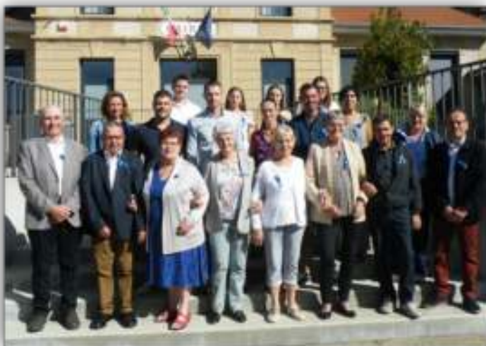
Demi-décade en 8