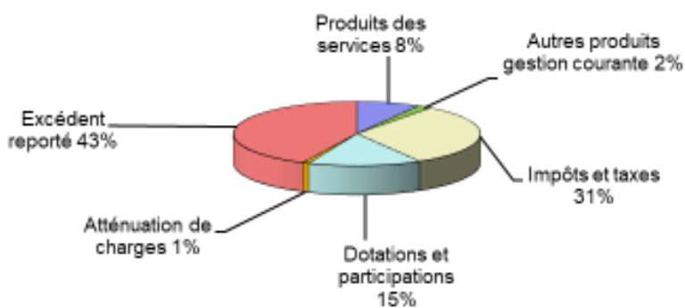
Recettes de fonctionnement réalisées