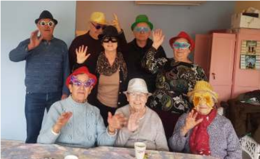
Les personnes qui participent aux jeudis récréatifs ont fêté carnaval.