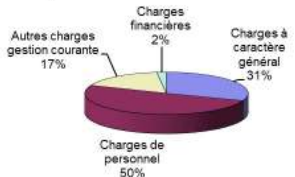
Dépenses de fonctionnement réalisées