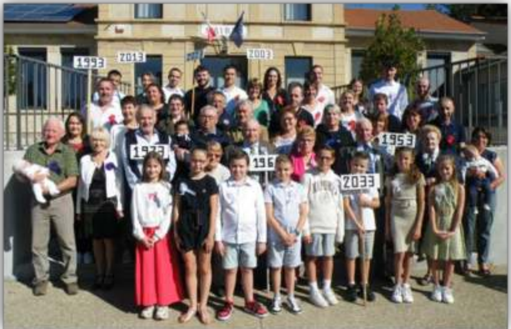
Classe en 3